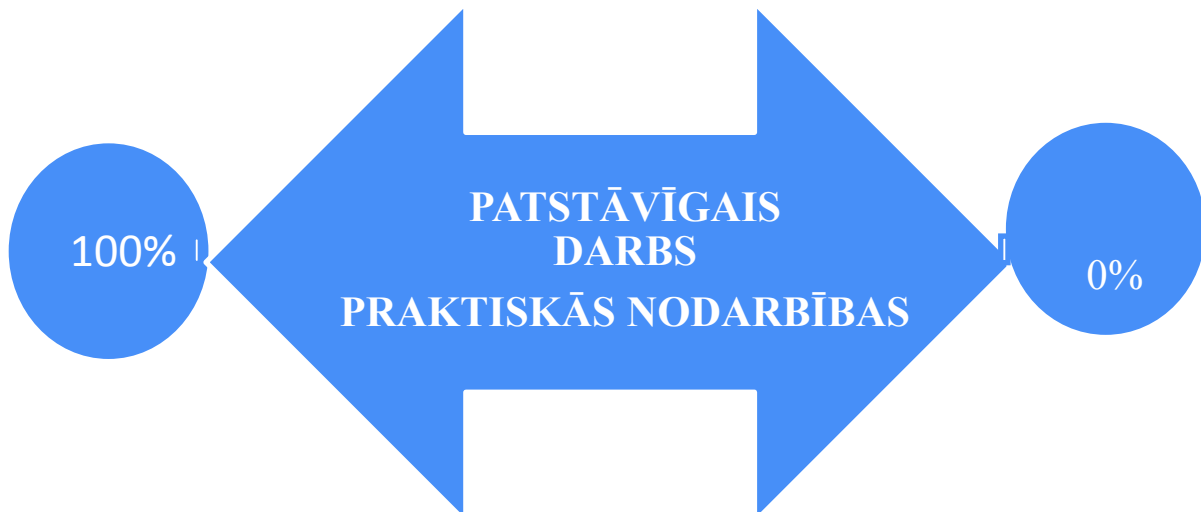
1.att. Patstāvīgā darba un praktisko nodarbību proporcijas

Kontaktnodarbību mērķis ir studiju materiāla izklāsts, grūtību pārvarēšana, mācību vielas atkārtošana, nostiprināšana, kā arī kontrole. Tās studentu sagatavo patstāvīgam darbam starpsesiju periodā. Praktisko nodarbību laiks ir limitēts.